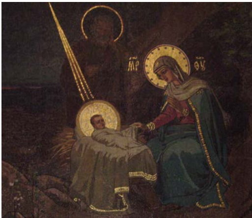
Geburt Christi Ikone in der „Erlöserkirche auf dem Blute“ in St. Petersburg

Ich selbst bin erst am 10.9. mit meiner Familie nach Kaufbeuren gezogen. Seit August 2013 war ich aber in der Flüchtlingshilfe in der Bayernkaserne tätig (zum damaligen Zeitpunkt eine der beiden Erstaufnahmen in Bayern). Zunächst arbeitete ich ehrenamtlich in der Kleiderkammer, die von der nahe gelegenen Hoffnungskirche eingerichtet worden war, später wechselte ich in die Beratung für Schwangere und junge Mütter. Ursprünglich hatte ich Vor- und Frühgeschichte studiert, wovon vor allem das große Interesse an den verschiedenen Kulturen geblieben ist. Bei meiner jetzigen Tätigkeit beobachte ich gespannt, wie der weitere Weg der Asylsuchenden aussieht, nachdem ich sie jahrelang nur bei ihren ersten Schritten in Deutschland beobachten konnte. Wieviel mehr menschliche Wärme umfängt sie doch hier in Kaufbeuren! Zum Teil sind hier echte Freundschaften entstanden - und wieviel Trauer herrscht dann, wenn diese Freunde nicht in Deutschland bleiben dürfen. In der kurzen Zeit konnte ich erst ein paar Einblicke gewinnen, aber das Wenige zeigt: hier herrscht echte Menschlichkeit!