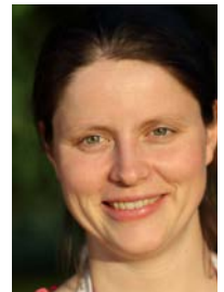
Nach Pfingsten Mutterschutz