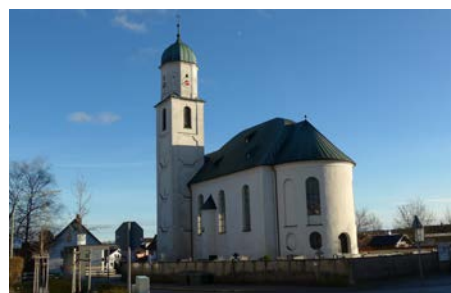
Oberbeuren, St. Dionysius 11:00 Uhr

Mit diesen neuen Gottesdienstzeiten kann eine Pfarrerin oder ein Pfarrer zwei Gottesdienste an einem Vormittag halten, ohne dass Stress und Hektik entstehen. Aber auch für die Organisten ist diese Regelung einfacher.