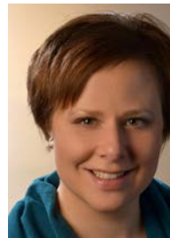
Februar + März Studienzeit Nach Pfingsten Urlaub