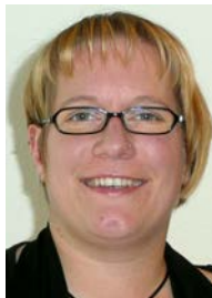
Nach Pfingsten Urlaub