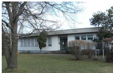
Haken, Jakob-Brucker-Haus 9:30 Uhr