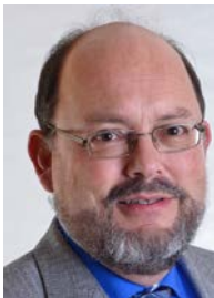
Ab Ostern Tagungen Nach Pfingsten Urlaub