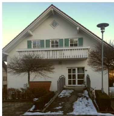
Biessenhofen, kath. Pfarrheim 9:30 Uhr

Ab der Passionszeit 2016 gelten folgende Anfangszeiten für unsere monatlichen Gottesdienste in den Außenorten: